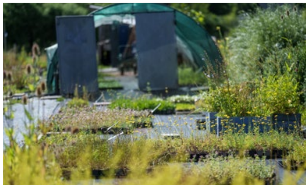
In der Gärtnerei in Klappholz produziert »Blütenmeer« Wildstauden in Topfballen. Auch Reigosaatgut wird dort angeboten.

So geht's: Alle Infos zur Kooperation sind unter www.blutenmeer-gmbh.de/aktion zu finden.